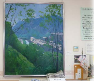
上 <透析ロビー> 「盛衰 - 足尾銅山」F130 第65回旺玄展出品作品1999