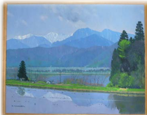
左 <正面玄関> 「安曇野早春」F100 第44回神奈川旺玄展出品作品2004