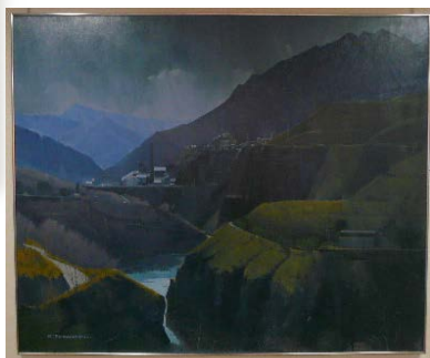
右 <院長室> 「足尾一歳月」F100 旺玄会受賞作家選抜展出品作品