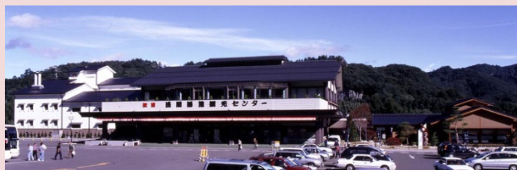
浅間酒造観光センター