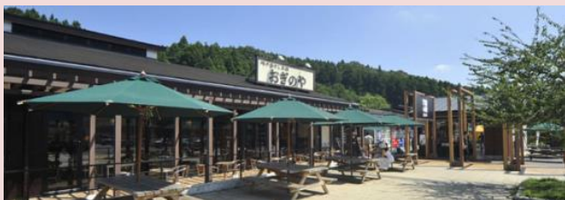
横川サービスエリア峠の釜めしおおぎや （NEXCO東日本ホームページより）